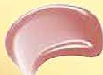
79008-0 Rosa Cristal