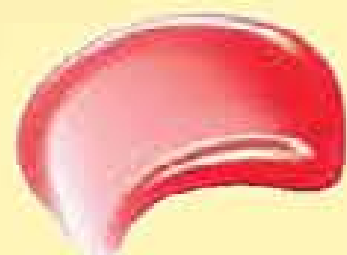
79010-2 Coral Sofisticado

Peça o estojo pelo código referente à sua tonalidade preferida de Gloss: