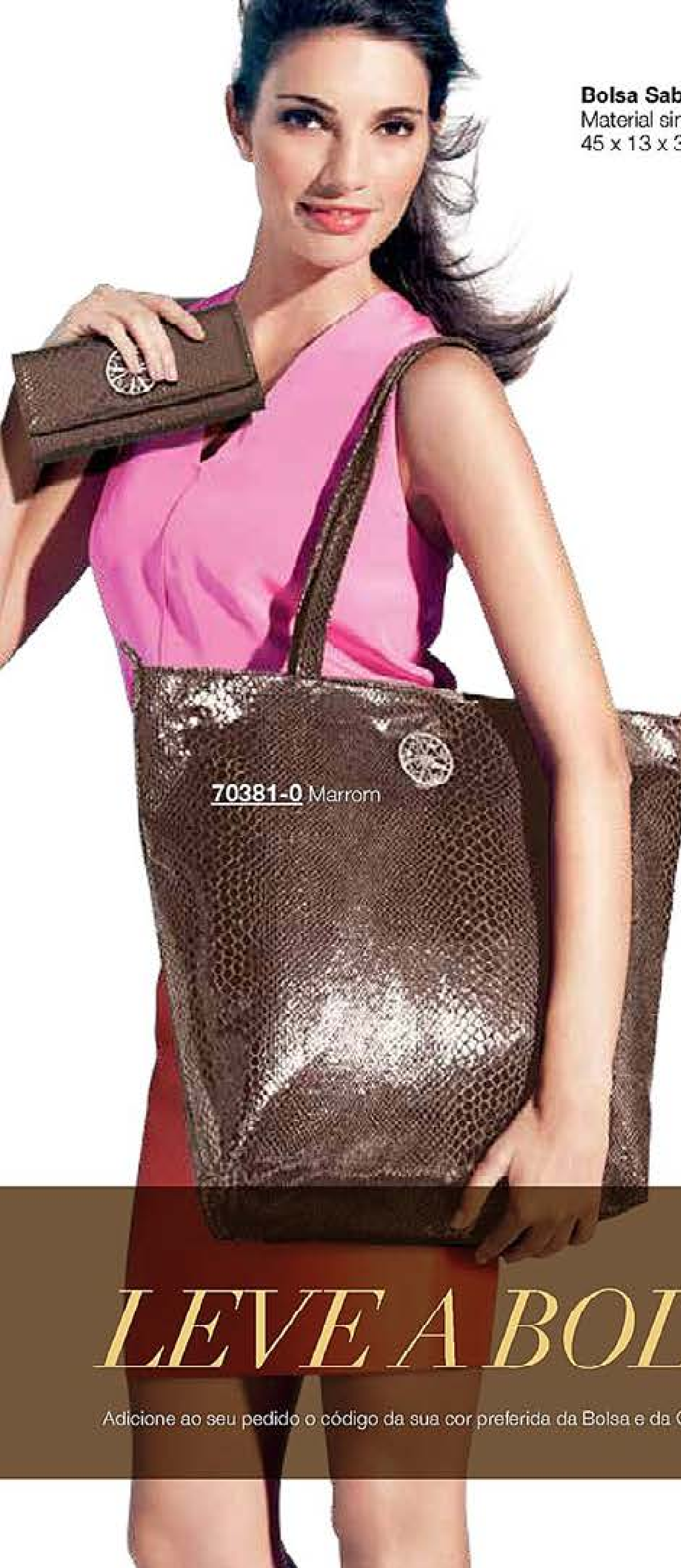
Bolsa Sabella Material sintético. 45 x 13 x 38 cm