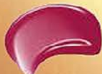
79009-0 Seda Pink