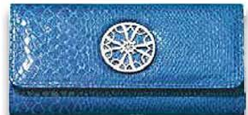
Carteira Sabella Material sintético. 19 x 1 x 10 cm