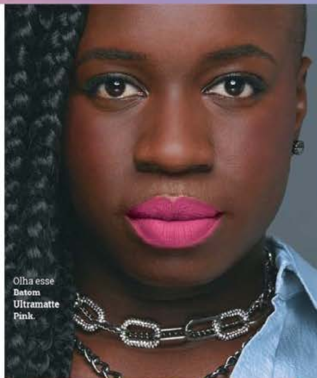
Olha esse Batom Ultramatte Pink.

Avon Ultramatte Batom 3,6 g R$ 24,99 CADA