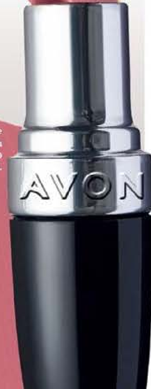
Olha esse Batom Ultracremoso Malva Floral.