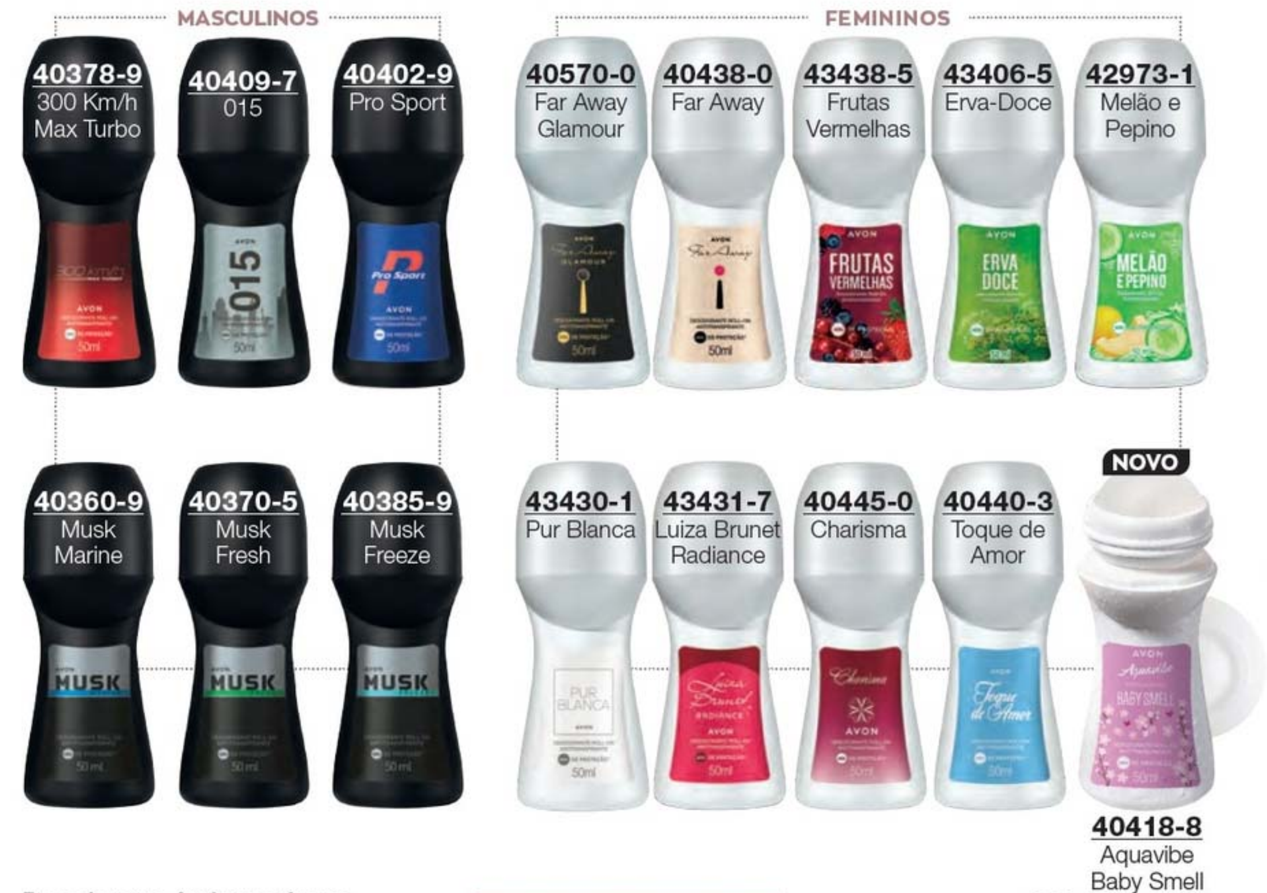
Desodorante Antitranspirante Roll-On 50 ml