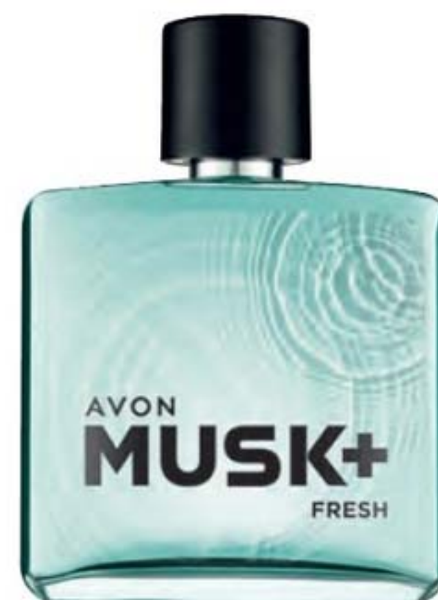
40298-4 Fresh Ervas madeira

QUANDO USAR: no dia a dia, em um clima diurno.