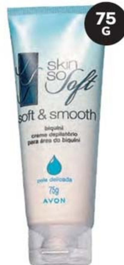
40000-9 Skin So Soft Soft & Smooth Creme Depilatório para Área do Biquini 75 g