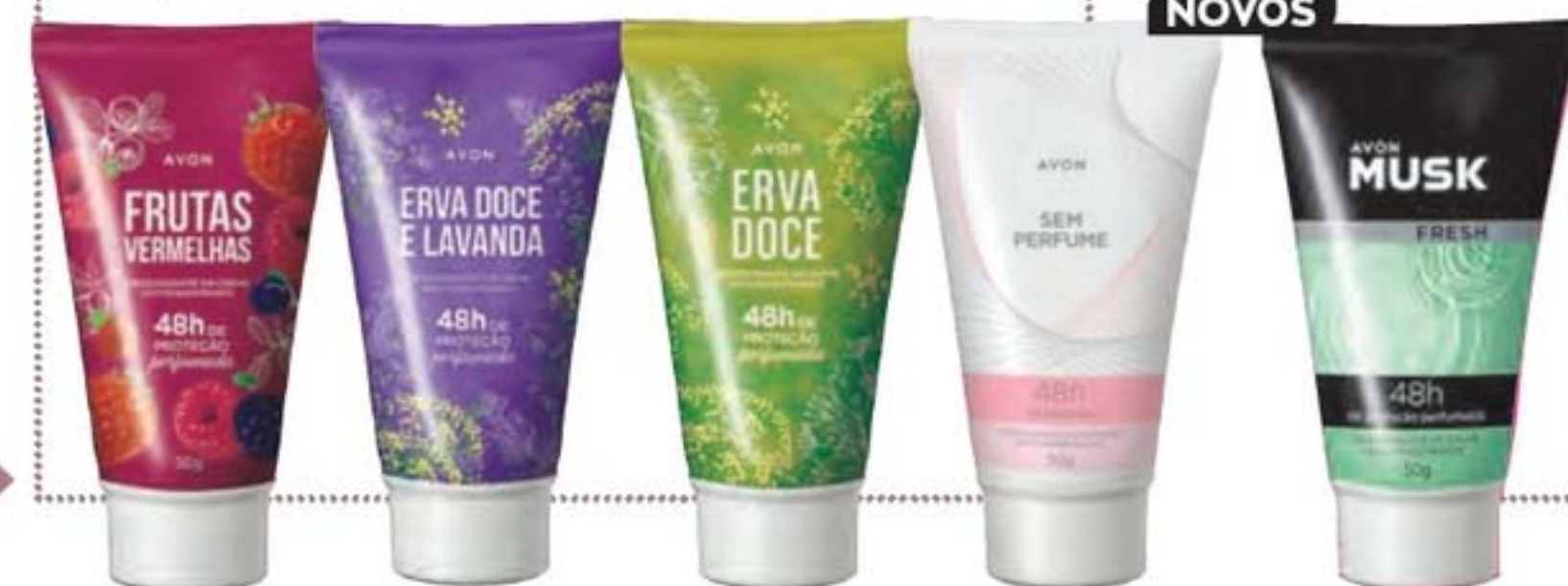
42551-9 Frutas Vermelhas 40918-4 Erva-Doce e Lavanda 42390-4 Erva-Doce 40474-4 Sem perfume 40292-1 Musk Fresh

indique o desodorante em bisnaga que tem o dobro de proteção em embalagem mais prática.