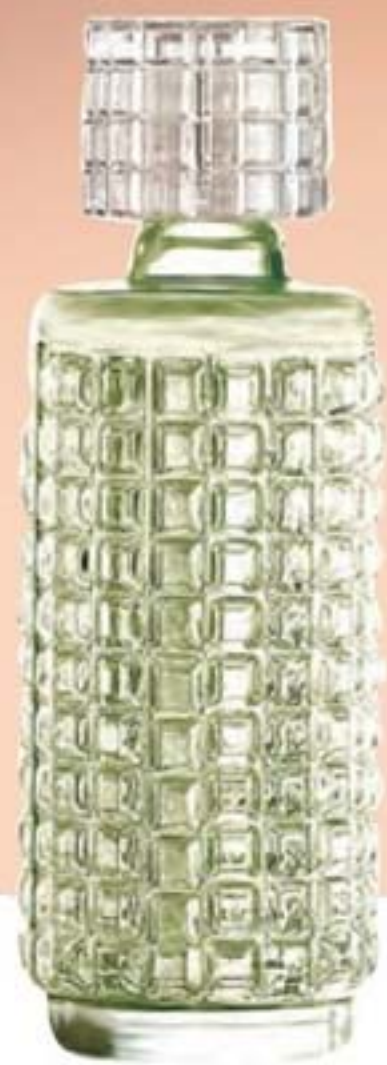
50872-7 Charisma Floral