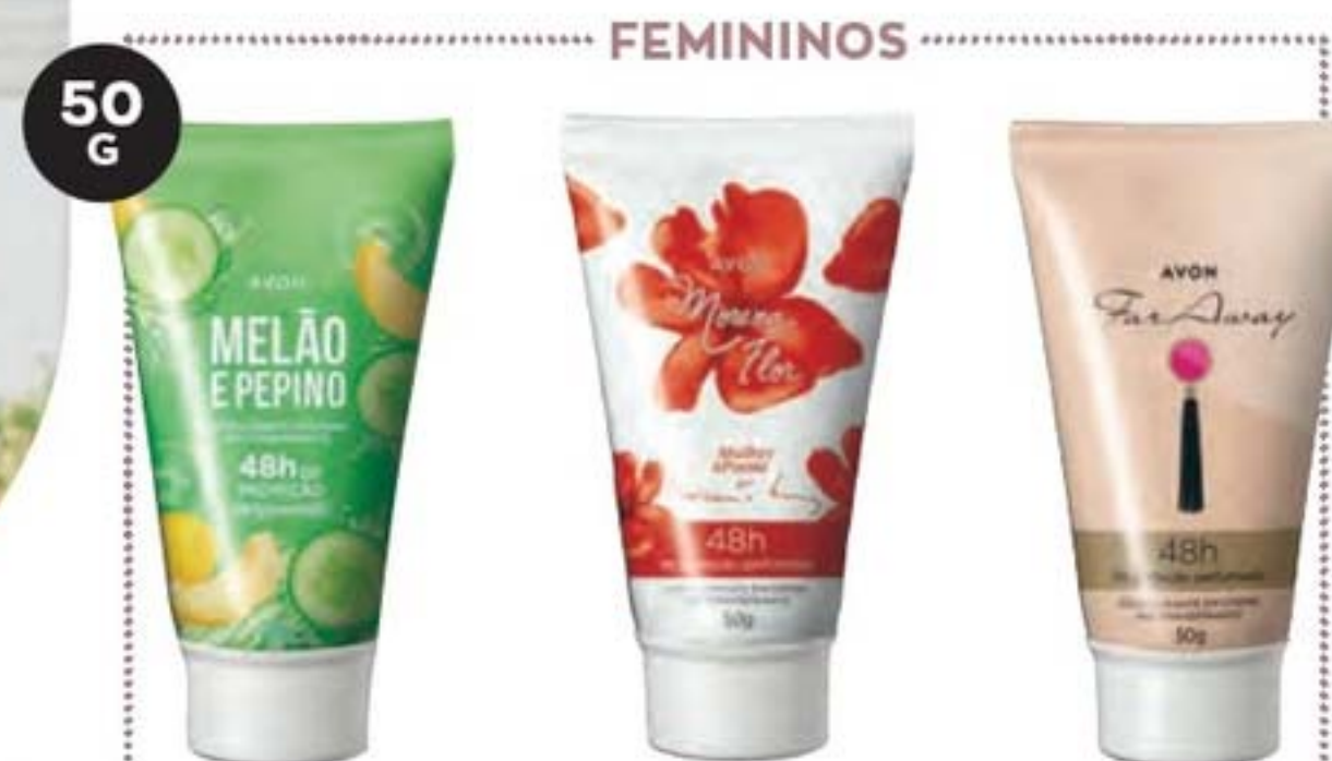
41294-0 Melão e Pepino 42499-0 Morena Flor 42498-5 Far Away

48 horas de proteção Desodorante e antitranspirante Fórmula sem álcool