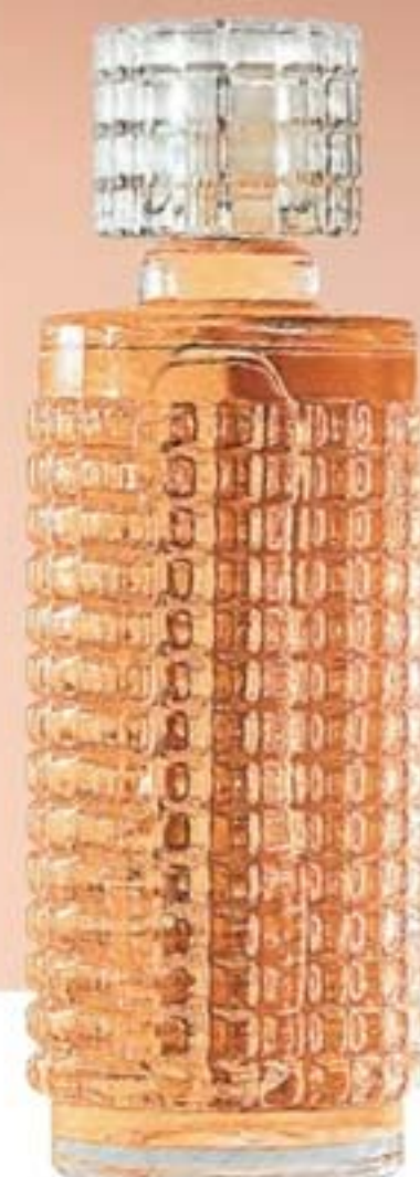
50878-0 Toque de Amor Frutal floral