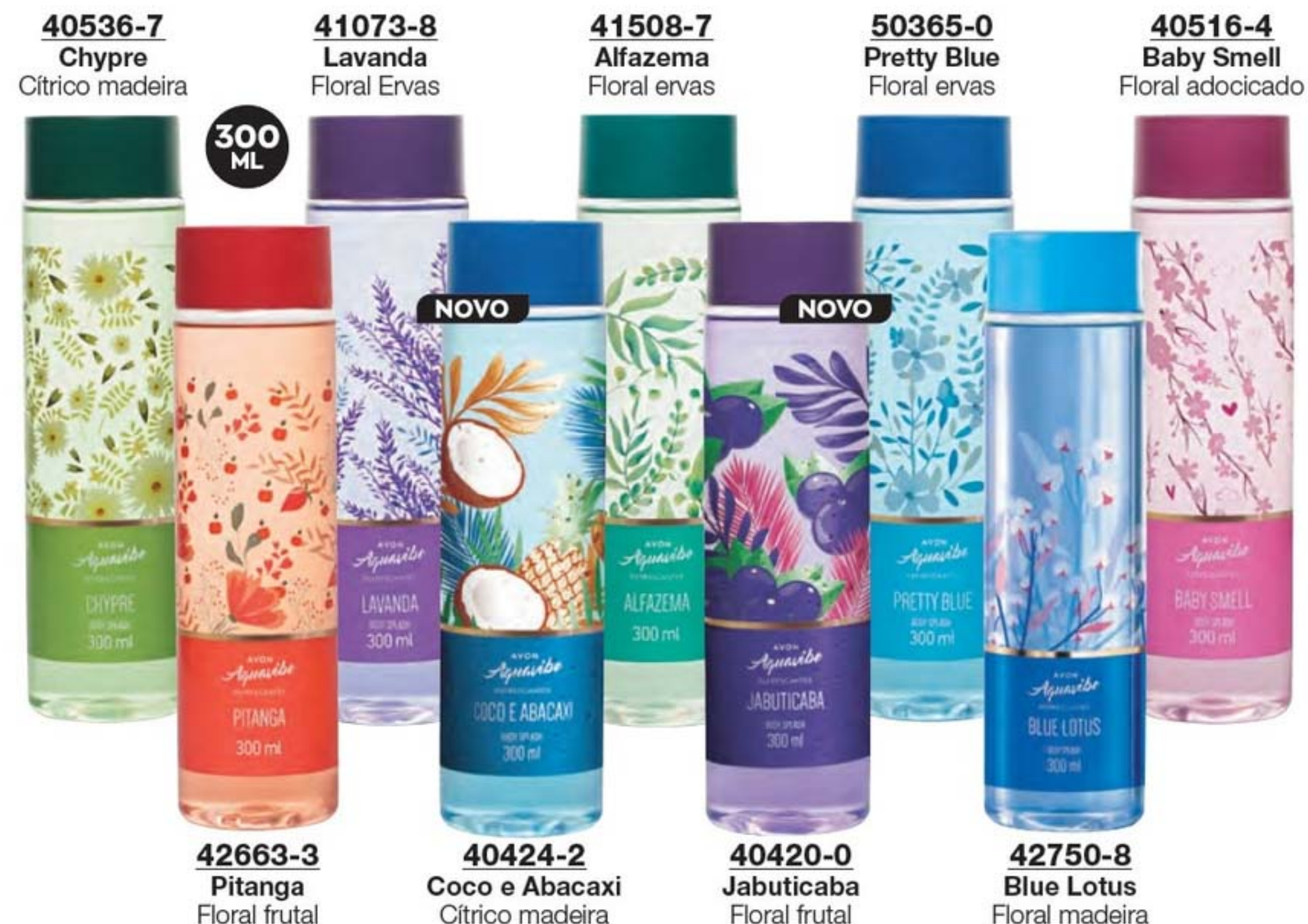
40536-7 Chypre Cítrico madeira