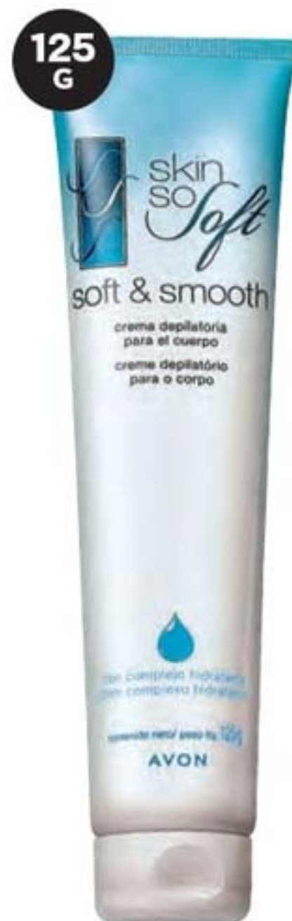
41588-8 Skin So Soft Creme Depilatório para o Corpo 125 g

DEPILAÇÃO COMPLETA EM MENOS DE 3 MINUTOS Produtos para o corpo, rosto e área do biquini para quem prefere uma depilação indolor no conforto da sua casa.