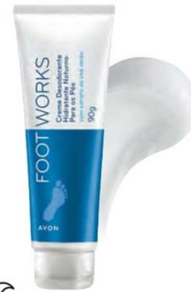
43828-8 Foot Works Creme Hidratante Noturno para os Pés 90 g