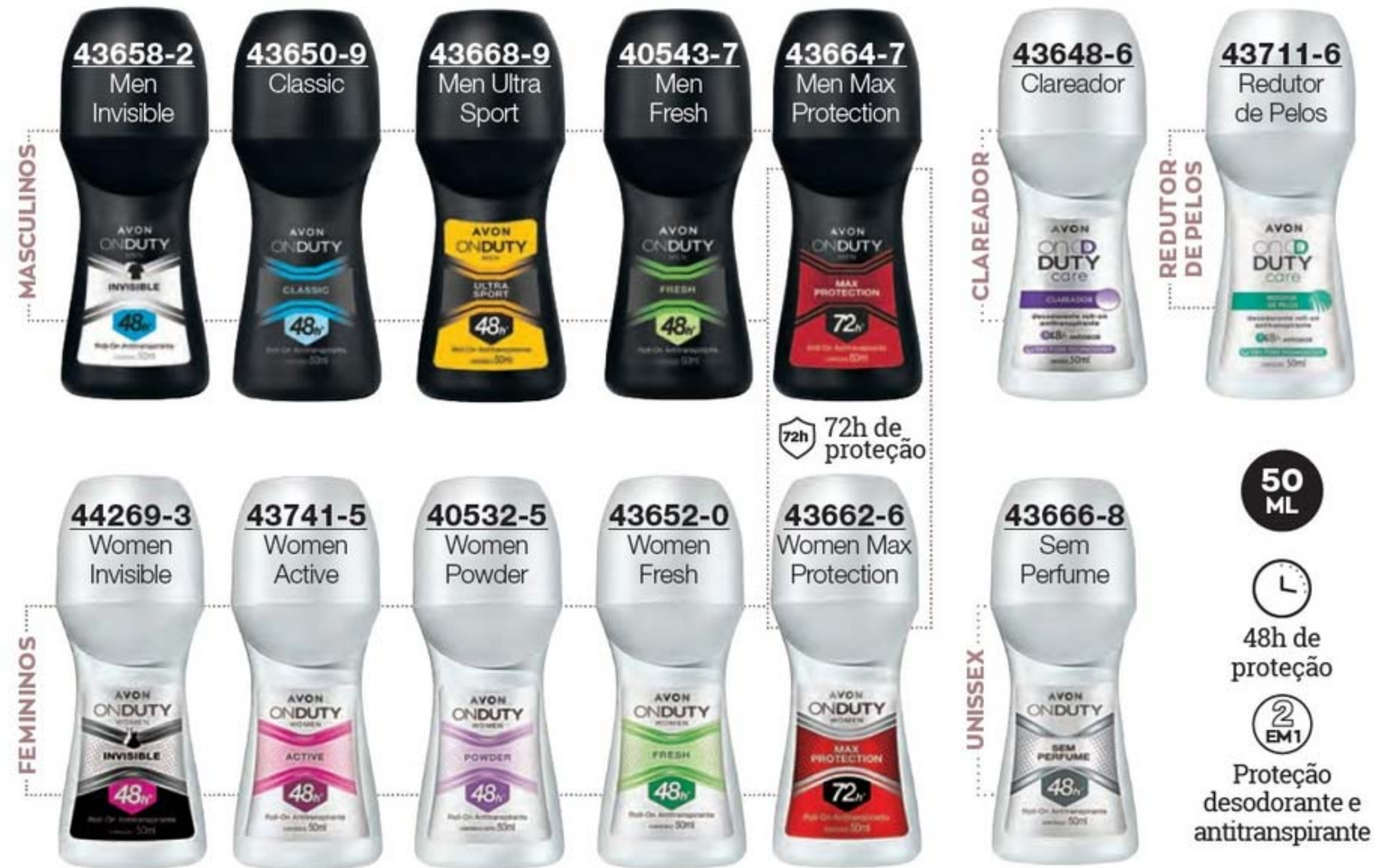
On Duty Roll-On Antitranspirante 50 ml