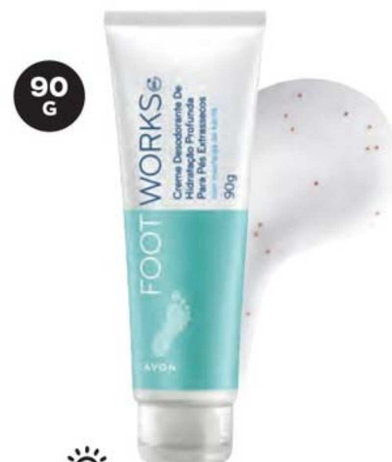
40086-2 Foot Works Creme de Hidratação Profunda para Pés Extrassecos 90 g

CREME PARA A NOITE Para quem precisa de um creme que age durante toda a noite e deixa os pés macios logo pela manhã.