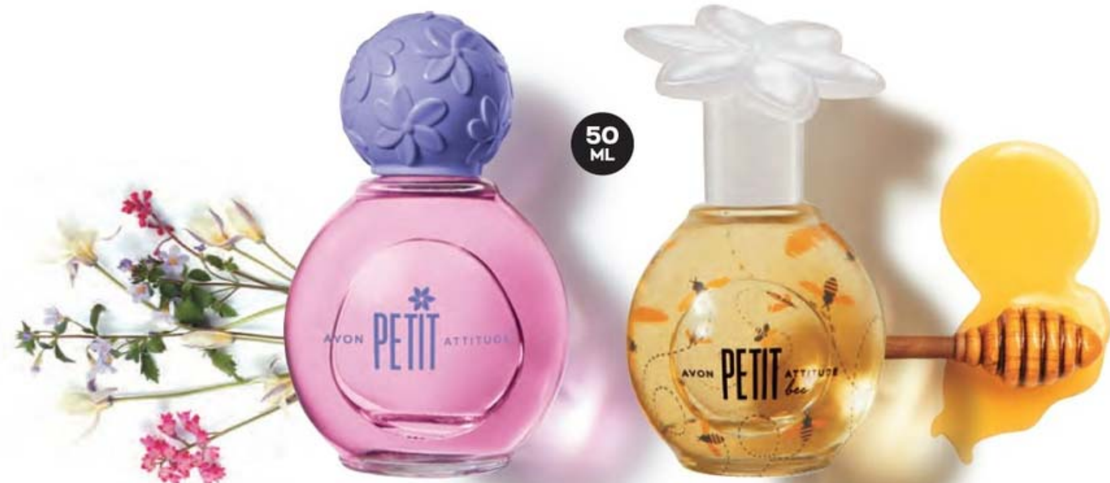
43341-6 Petit Frutal floral

DOCE COMO O MEL Quem gosta de perfumes bem docinhos e leves vão amar Petit Bee. QUANDO USAR: em momentos de lazer.