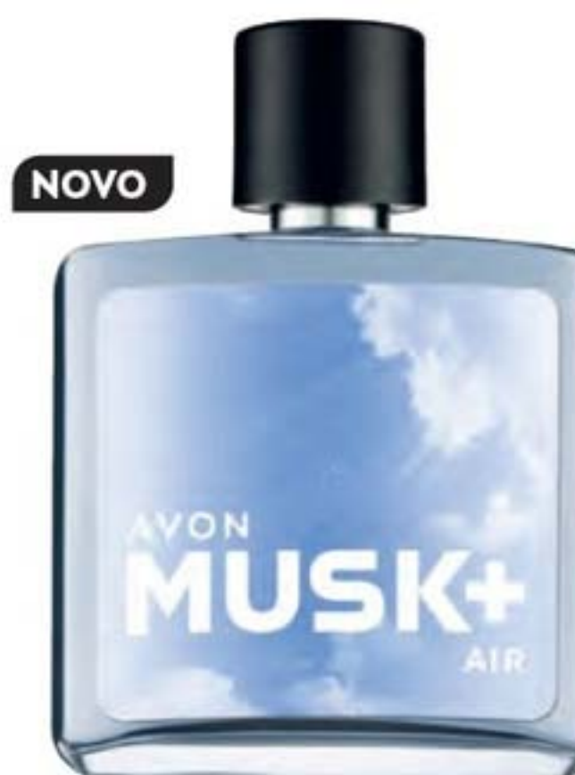
40693-6 Air Ervas cítrico