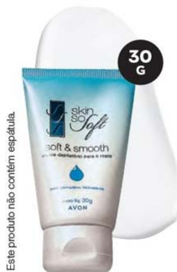
41529-5 Skin So Soft Creme Depilatório para o Rosto 30 g