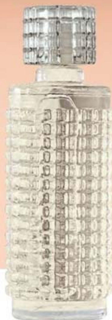
50873-2 Sweet Honesty Cítrico adocicado