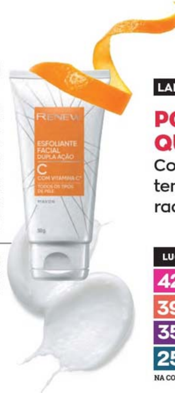
40476-5 Renew Esfoliante Duplo 50 g