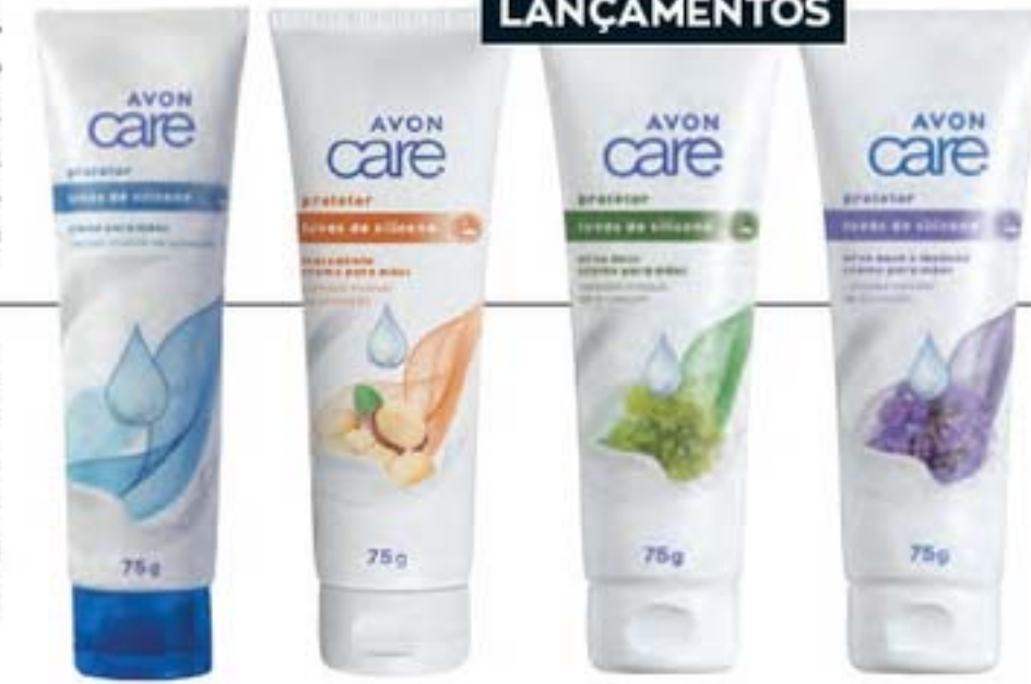
40665-8 Avon Care Luvas de Silicone Creme Protetor para Mãos 75 g

DEM DE LUCRO IMPERDÍVEL Aqui tem lucro acima do seu nível de Estrela. Não perca esta oportunidade de faturar mais!