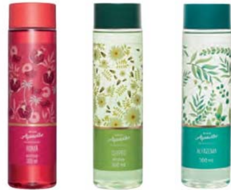
40505-2 Romã Floral frutal 40536-7 Chypre Cítrico madeira 41203-8 Alfazema Floral ervas

PRA COLECIONAR Apresente o frasco de 300 ml para quem gosta de variar a fragrância ou ainda não conhece o novo perfume Melancia.