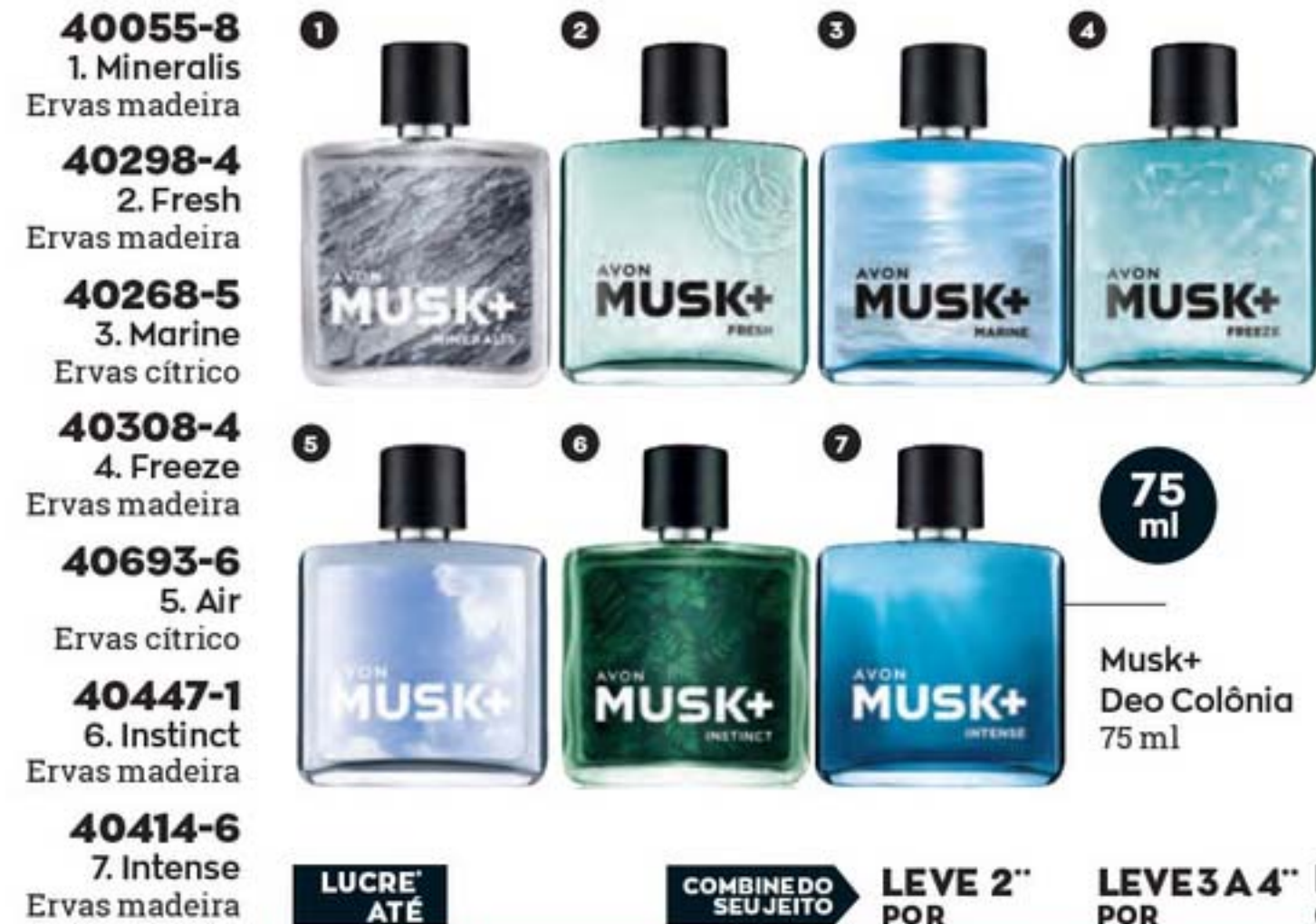
40055-8 1. Mineralis Ervas madeira 40298-4 2. Fresh Ervas madeira 40268-5 3. Marine Ervas cítrico 40308-4 4. Freeze Ervas madeira 40693-6 5. Air Ervas cítrico 40447-1 6. Instinct Ervas madeira 40414-6 7. Intense Ervas madeira

NA COMPRA DE 10 UNIDADES REVENDA POR ATÉ R$ 299,90