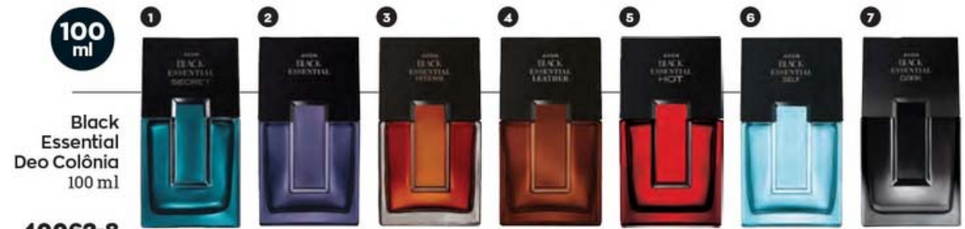
100 ml Black Essential Deo Colônia 100 ml

NA COMPRA DE 5 UNIDADES REVENDA POR ATÉ R$ 314,50