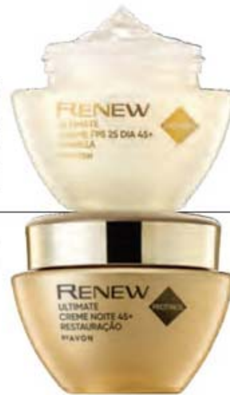
Renew Ultimate Creme 50 g

MAIS FIRMEZA, MENOS RUGAS MODERADAS Indique as versões dia e noite para resultados mais eficientes.