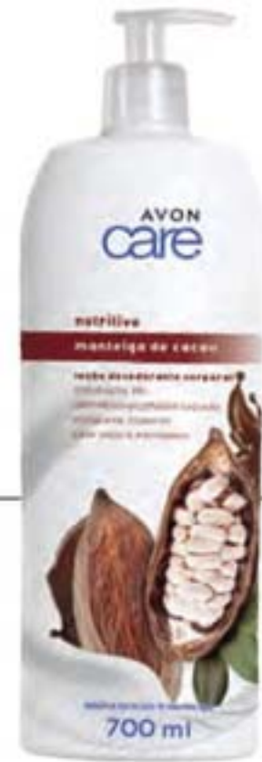
40647-6 Hidratante Intensivo Manteiga de Cacau