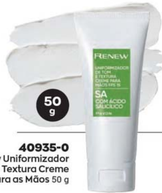
40935-0 Renew Uniformizador de Tom e Textura Creme para as Mãos 50 g

MÃOS SEM MARCAS Creme uniformiza o tom irregular da pele, reduzindo diferentes tipos de marcas. 100% das mulheres tiveram melhora na textura em 1 semana.**