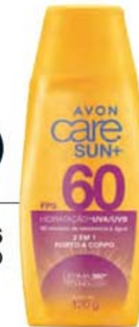
Avon Care Sun+ Protetor Solar 120 g