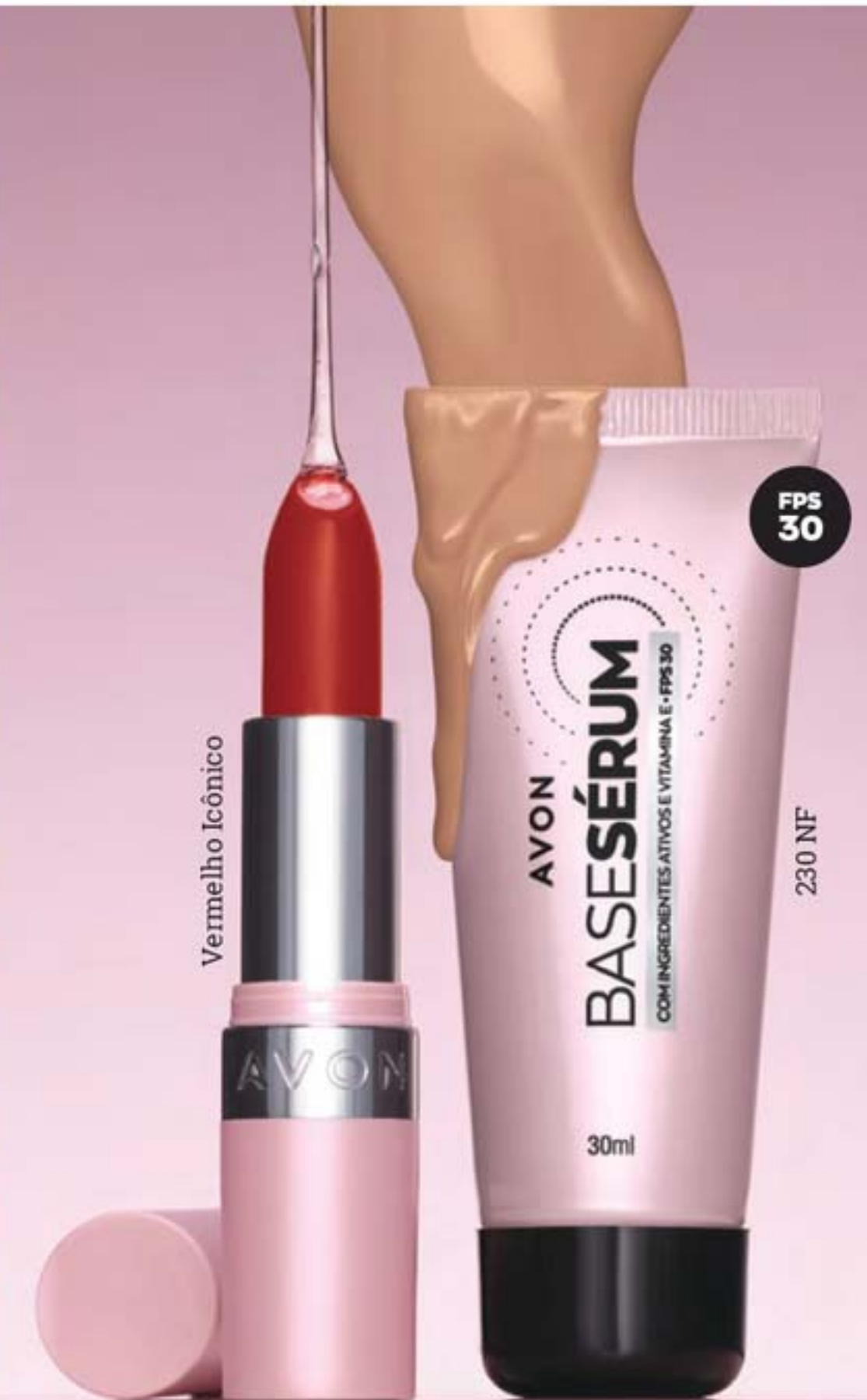
Avon Hydramatic Batom Matte® 3,6 g