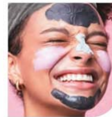
Clearskin Máscara Facial 60 g

NA COMPRA DE 2 UNIDADES REVENDA POR R$ 67,80