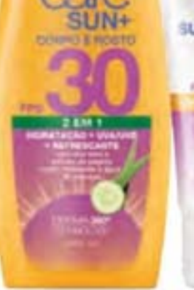
41389-9 Rosto Controle de Brilho FPS 30