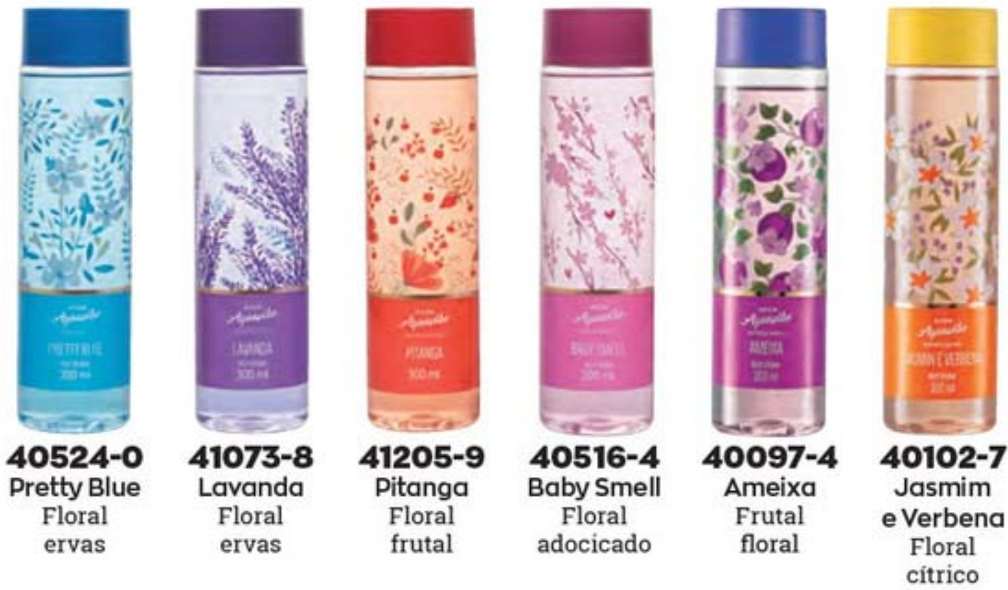
40524-0 Pretty Blue Floral ervas 41073-8 Lavanda Floral ervas 41205-9 Pitanga Floral frutal 40516-4 Baby Smell Floral adocicado 40097-4 Ameixa Frutal floral 40102-7 Jasmim e Verbena Floral cítrico

TENHA EM ESTOQUE E LUCRE MUITO UMA SELEÇÃO DE PERFUMES FEMININOS E MASCULINOS PARA TODO TIPO DE CLIENTE.