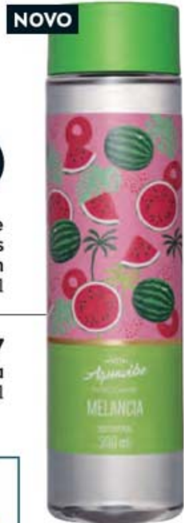
300 ml Aquavibe Refreshantes Body Splash 300 ml