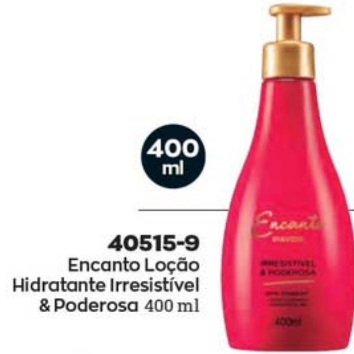
40515-9 Encanto Loção Hidratante Irresistível & Poderosa 400 ml