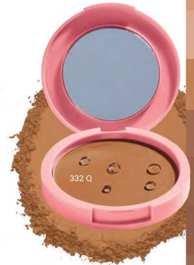
FOTO SEM FILTRO Pra quem ama selfie: formulado com ingredientes que controlam a oleosidade e o suor, com acabamento leve.

Color Trend Matte Real Pó Compacto Facial à Prova D'Água 8 g