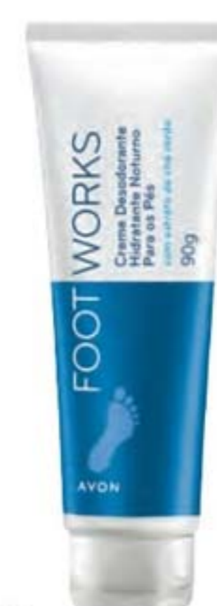
43828-8 Foot Works Creme Hidratante Noturno para os Pés

CREME PARA A NOITE Para quem precisa de um creme que age durante toda a noite e deixa os pés macios logo pela manhã.