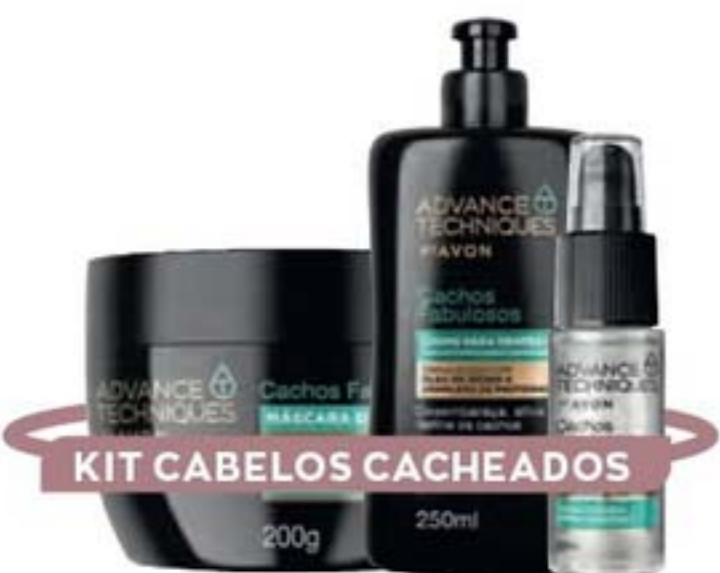
KIT CABELOS CACHEADOS

NA COMPRA DE 2 UNIDADES REVENDA POR ATÉ R$ 63,98