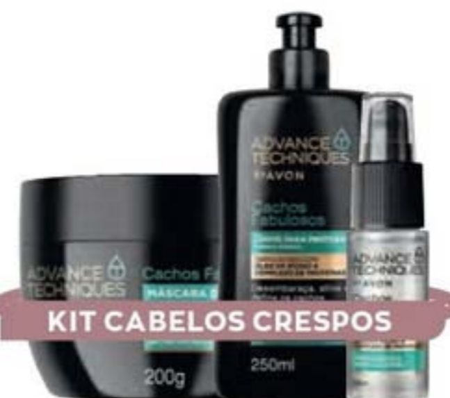
KIT CABELOS CRESPOS

Indique este kit para a cliente que tem cabelos crespos e quer prevenir nós e facilitar o pentear.