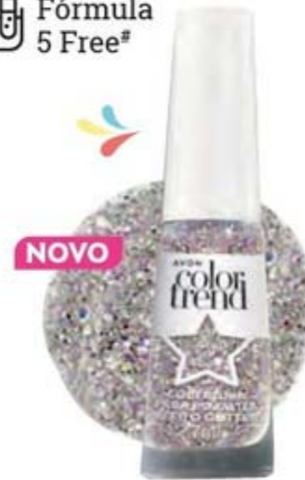
40469-5 Color Trend Cobertura para Esmaltes Efeito Glitter 7 ml