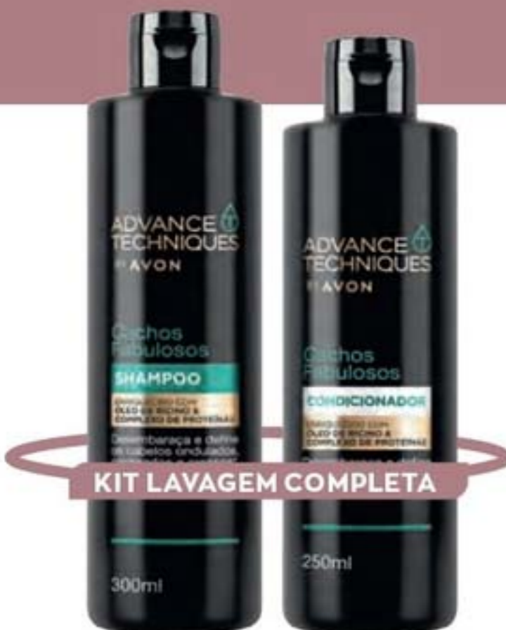
KIT LAVAGEM COMPLETA

Indique para a cliente usar todos os dias na hora do banho. Os produtos deixam os cachos mais disciplinados, desembaraçados e definidos.