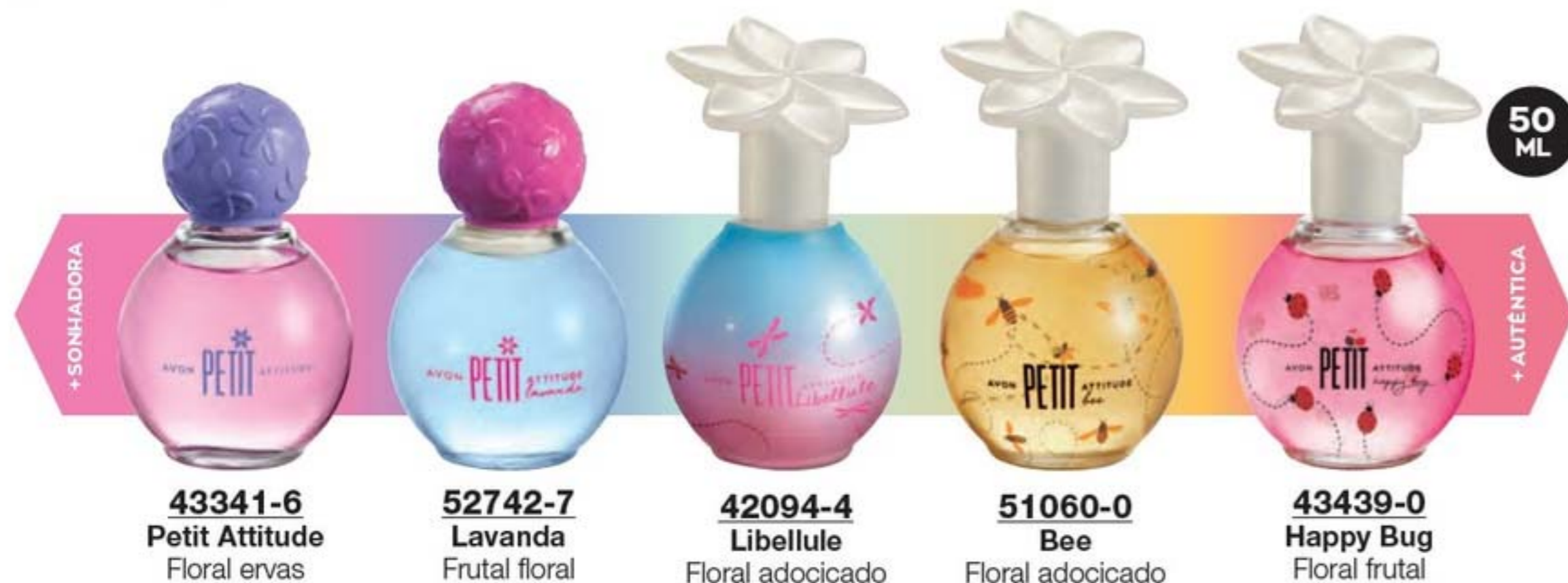
43341-6 Petit Attitude Floral ervas

QUANDO A CLIENTE DEVE USAR? Durante o dia em momentos de lazer e diversão com os amigos.