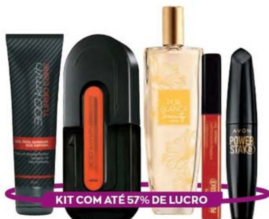
KIT COM ATÉ 57% DE LUCRO