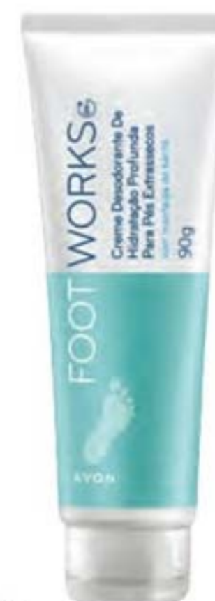
40086-2 Foot Works Creme de Hidratação Profunda para Pés Extrassecos

CREME PARA O DIA Para a cliente que precisa hidratar os pés profundamente e mantê-los macios durante o dia todo.