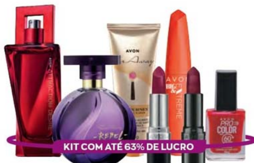
KIT COM ATÉ 63% DE LUCRO

1 300 Km/h Turbo Care Gel Para Barbear 90 g + 1 300 Km/h Deo Colônia. Cítrico ervas. 100 ml + 1 Pur Blanca Serenity Deo Colônia. Floral fresco. 75 ml + 1 Avon Power Stay Batom Líquido. Vermelhaço. 7 ml + 1 Avon Power Stay Máscara Extra Volume 10 g