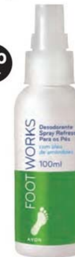
40163-0 Foot Works Desodorante Spray Refrescante para os Pés

SPRAY PARA USO DIÁRIO Para quem quer um produto com ação hidratante e desodorante que é fácil de aplicar e seca rapidamente.