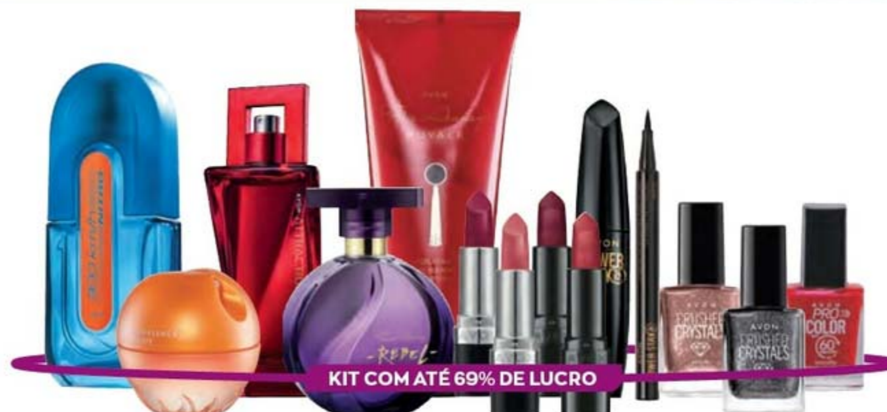
KIT COM ATÉ 69% DE LUCRO

1 Attraction Desire for Her Deo Parfum. Adocicado madeira. 50 ml + 1 Far Away Rebel Deo Parfum. Adocicado floral. 50 ml + 1 Far Away Creme para as Mãos 75 g + 1 Avon Batom Ultracremoso FPS 15. Malva Belo. 3,6 g + 1 Avon Big&Extreme Máscara de Volume e Efeito Extensão de Cílios 10 g + 1 Avon Ultramatte Batom. Cereja. 3,6 g + 1 Avon Pro Color Esmalte. Vermelho Perfeito. 10 ml